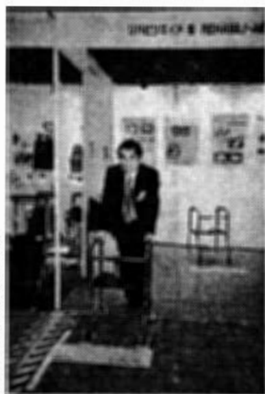
展示会などに出席して地道な営業を続ける

に二台機を試作、それが きっかけて歩行器の開発 が始まる。 九四年一月には、新工 ネルギー・産業技術総合 開発機構(NEDO)が 募集した福祉機器の実用