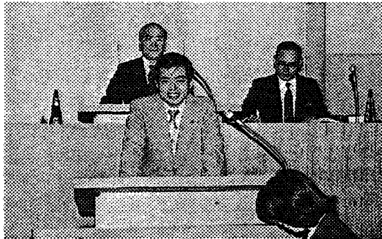
藤沢市会議員時代

年、複数の議員の輩出を 目指して「藤沢の夢を語 る会」を結成、見事次の 選挙には自分に代わり、 二人の候補者を擁立、当 選させた。